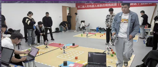
人形机器人场景应用实训