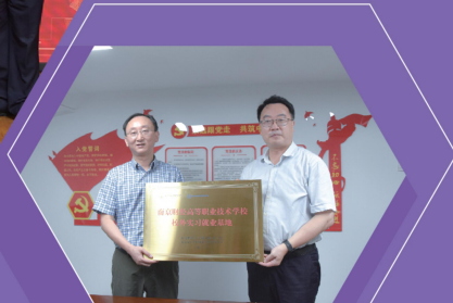
南京天正会计师事务所校外实训基地授牌