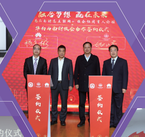
与华为共建云计算实训平台