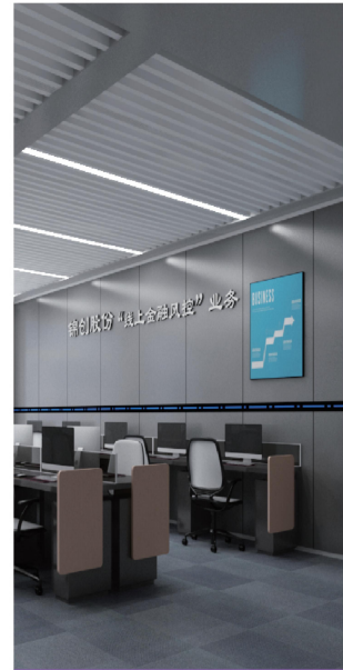
锦创股份“线上金融风控”实训室