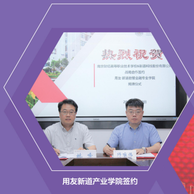
用友新道产业学院签约