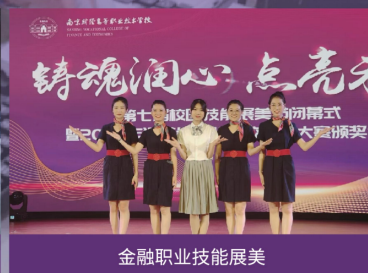
金融职业技能展美