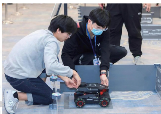
人工智能课程实训