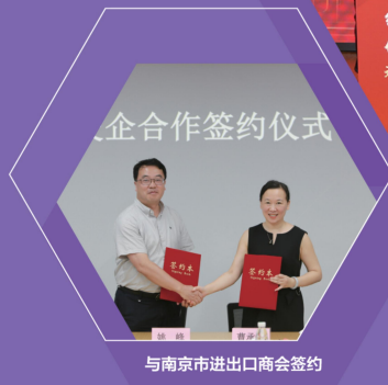
与南京市进出口商会签约