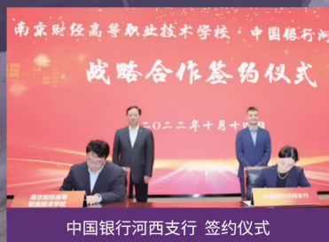
中国银行河南支行 签约仪式