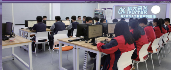
讯飞大数据技术实训