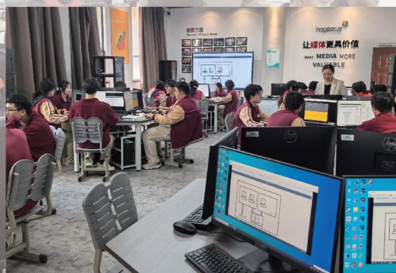
云计算虚拟化技术实训