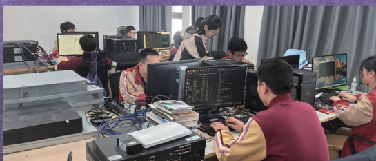
网络安全攻防实训