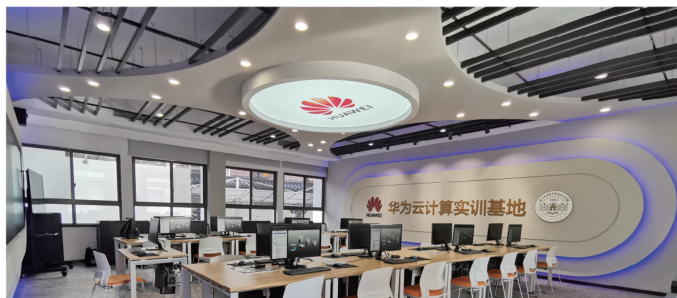
华为云计算实训基地