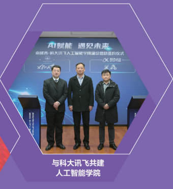
与科大讯飞共建人工智能学院