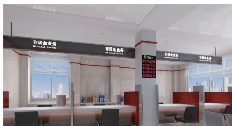
银行及保险服务培训中心