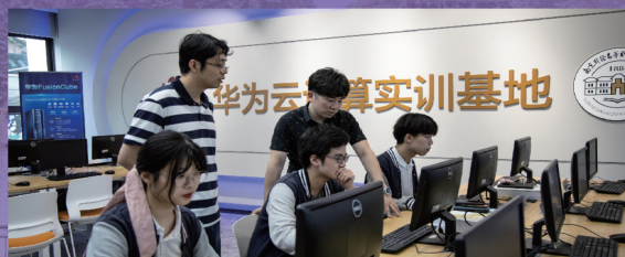
云计算平台部署实训