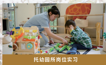
托幼园所岗位实习