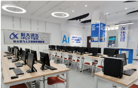
科大讯飞人工智能实训基地